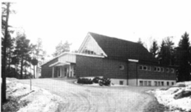
Hafslundsøy kirke våren 2003.

En valgkomité er allerede i arbeid med å