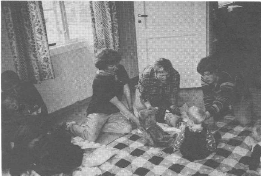
"Babysangtreff i Varteig"