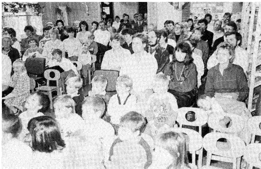
Fullt hus på Hasle under søndagsskolens 100-års fest.