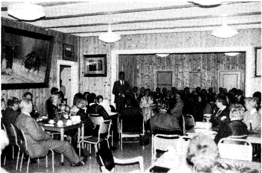
Fra kirkekaffen på kommunelokalt.