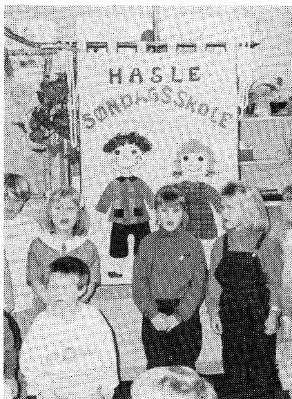
Noen av barna som sang under gudstjenesten.

Etter gudstjenesten hadde Hasle, Neaskog og Ovaskog søndagsskoler rigget til med bursdagskaker og mye annet godt. Det var fullt hus på Hasle Menighetssenter denne søndagen og det ble en fin markering av jubileet.