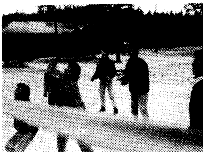
Bildet viser et av lagene i volleyballturneringen.

Imellom slagene ble det mye hyggelig samvær både konfirquantene imellom og mellom konfirmanter og ledere. En sliten, men fornøyd gjeng var det som søndag kjørte buss hjem til Varteig igjen.