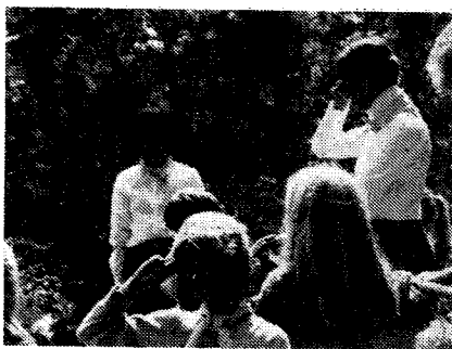
Fra opptagelsen. På bildet ser vi en av de opptatte meisene hilse på resten av flokken.